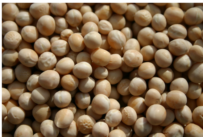
Ærter. (klik på billedet for stor udgave)

En af udfordringerne er fibre og fiberforbindelser i bælgsæd, som ikke er gode for de en-mavede. Der findes også en hel gruppe stoffer – Anti Nutrielle Faktorer – forkortet ANF'er, som hindrer en høj foderudnyttelse, og som kan påvirke fordøjelsen hos dyrene. Lars Egelund Olsen forklarer, at ANF'er er tanniner i hestebønner og ærter, vicin og convicin i hestebønner og ærter, alkaloider og oligosakkarider i lupiner og proteaseinhibitorer. De sidste kendes fra fx sojabønner, som varmebehandles for at inaktivere det, der hedder trypsininhibitorer.